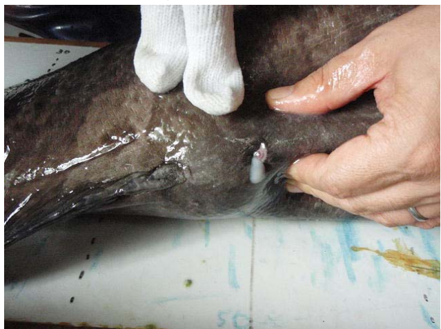
腹部圧搾により流れ出す精液

オス化の確認後、背部にダートタグを2本装着し、個体識別が容易にできるようにした後、他の親魚候補が養成されている50KL水槽に加えた。