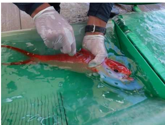
アプリケーターで標識を装着