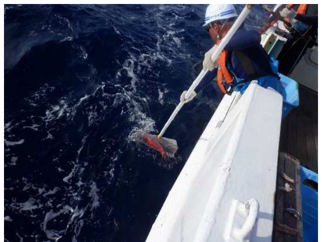
たも網を使用して船上から放流