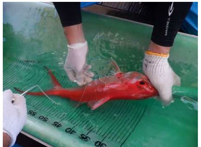
鰾のエア－抜き作業