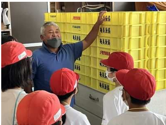
市場衛生管理について説明