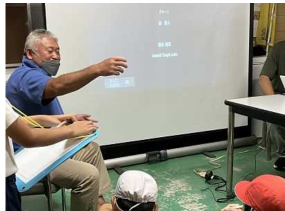
児童からの質問に対し回答