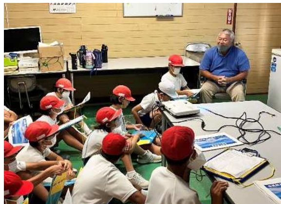
海について想いを伝える