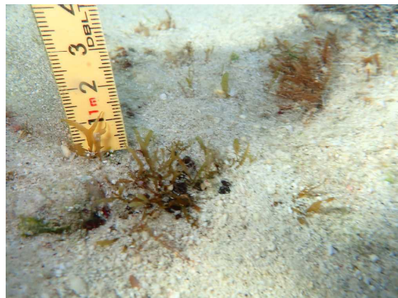
現在のホンダワラ類（10/18，藻長13mm）