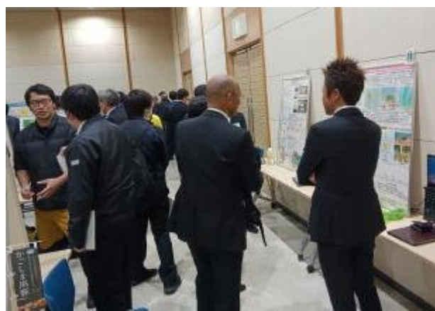
会場の様子（ポスター発表者と来場者のやりとり）

※水技の報告分をHPに掲載 kagoshima.suigi.jp/KenkyuHoukoku/R6kyoudou-index.html