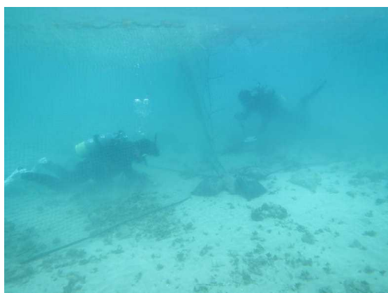
囲い網内での調査