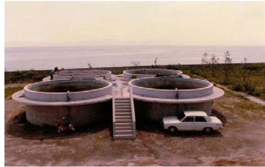
昭和55年：栽培漁業センター マダイ親魚用の野外大型水槽

その後、マダイの採卵に陸上水槽が用いられるようになり、昭和40年代の後半には瀬戸内の日本栽培漁業協会によつて安定した種苗生産技術が確立すると、その技術は逐次各県へと波及し、マダイ稚魚は100万尾単位の生産が可能となり放流事業や養殖種苗に供されることになりました。