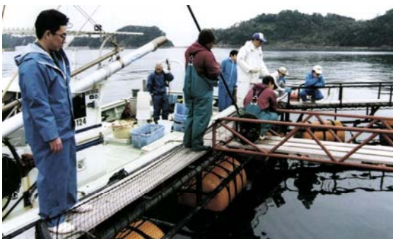
笠沙町での試験状況

この成果は、マグロ類養殖システム開発グループによる「マグロ類養殖マニュアル」(平成8年3月)及び「マグロ類養殖マニュアル補足・改訂版」(平成13年3月)に取りまとめられています。