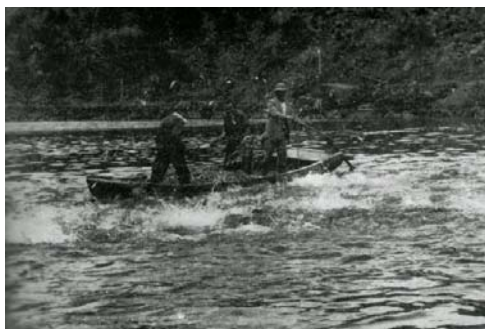
(昭和38年：牛根麓) 築堤式養魚場、投餌作業