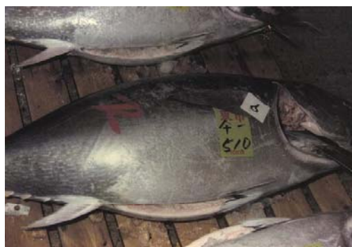
昭和52年：築地市場の養殖マグロ