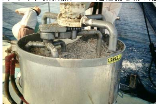
昭和63年：垂水市牛根モイストペレット

このOMPの特徴は、配合飼料が魚の水分を吸水して軟質のペレットが造れるため餌の溶出が少なく、生簀の外へ流失する餌は殆どないので飼料効率を高め、しかも海水を汚さない一石二鳥とも言える「優れもの」であることから、今日でも各地の養殖場で使用されています。