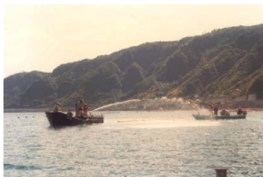
昭和55年4月：竜ヶ水沖 粘土散布機械の性能確認試験