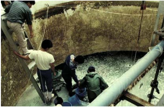
平成2年：県栽培漁業センター 試験用トラフグ種苗の取り上げ