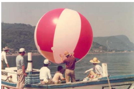
昭和54年5月：竜ヶ水沖 アドバルーンによる粘土拡散調査 上空から粘土の拡散状況を写真撮影

以上のような研究成果から、一部、国の補助もあって長島町（東町）や鹿児島湾では赤潮対策用として常時、所定の倉庫には赤潮対策用粘土が保管されるようになりました。これらの結果については、水産庁の赤潮対策開発試験成果集（3）の「粘土散布による赤潮被害防止マニュアル」（昭和57年3月）として水産庁漁場保全課へ報告しています。