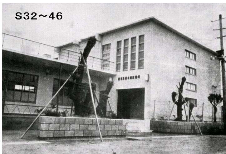
昭和36年当時の水産試験場（鹿児島市塩屋町）

その業務は、他の部に属さない要するに漁業部、製造部、養殖部に属さないもの、あるいは場全体にわたるような業務、試験場の広報（例えば月刊誌「うしお」や年報の「事業報告書」の発行）や図書の管理、漁業公害を含めた漁場環境調査、魚礁調査、そして、かん水魚類（ハマチ・ブリ）の養殖試験です。昭和34年から牛根地先でブリ養殖試験（牛根地先）が決まるまで、連日のように夜おそくまで、今後の進むべき方向とか、取り組むべき業務等について話し合いが続いていたと聞いています。