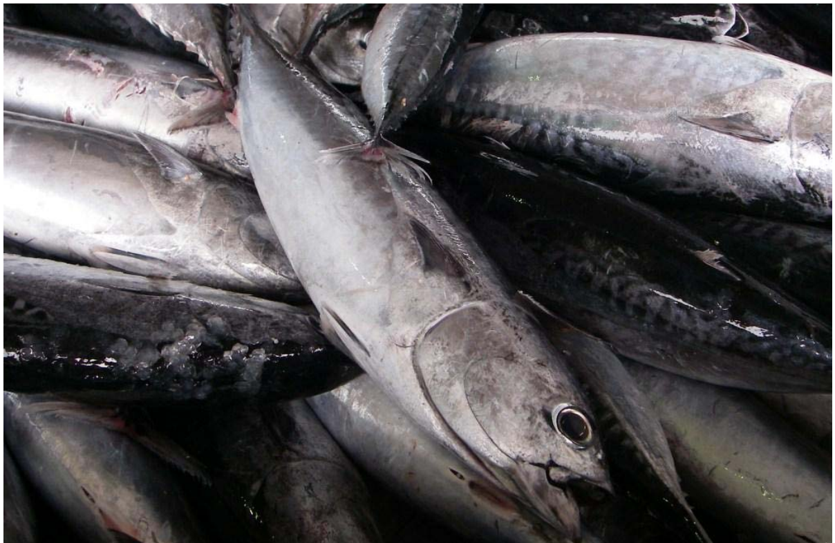
マルソウダ（メチカ）