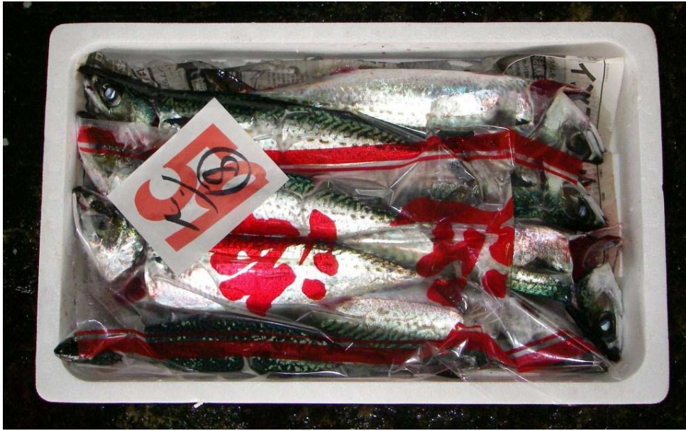
ゴマサバ (首折れサバ)