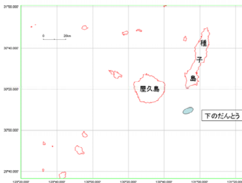
マチ類標識放流位置図