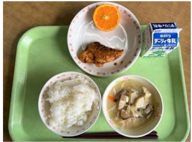
地魚を使用した給食 屋久島産白身魚の黒糖ソース