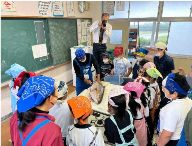
料理教室の様子（屋久島町小瀬田小） 令和4年11月18日