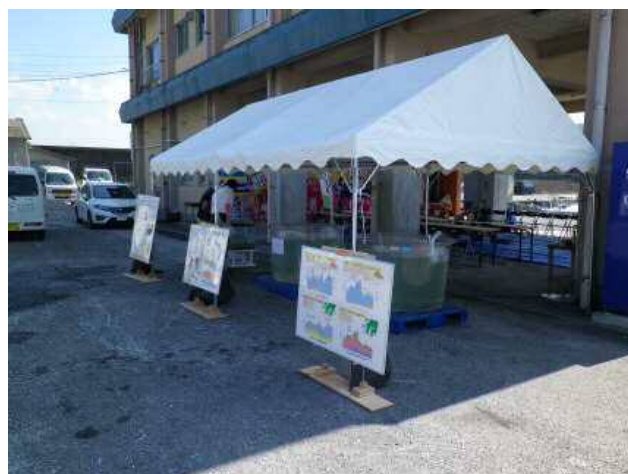
放流効果説明用のパネルと放流魚の展示