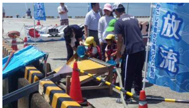
園児たちによる放流