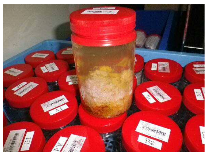
今回の調査で採取したサンプル