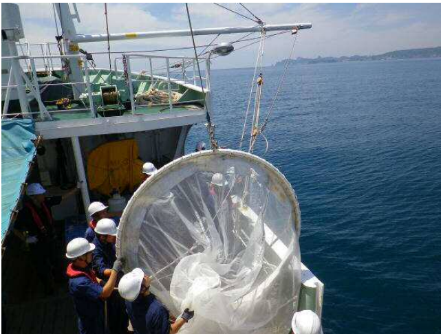
調査に用いたリングネット

クロマグロ仔稚魚の分布様式には、不明な点も多いことから、今回の調査結果がその解明に寄与することに期待されます。