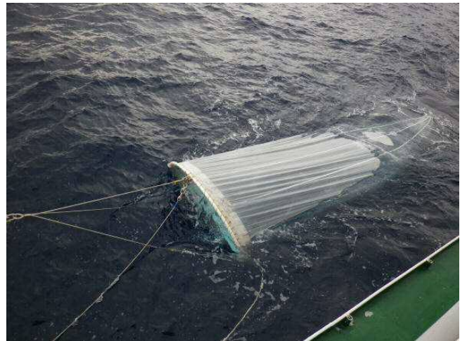
リングネット曳網