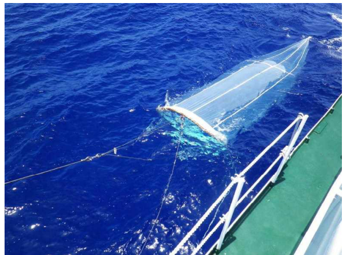
リングネット曳網