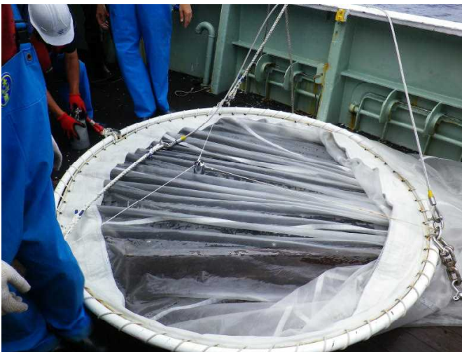
調査に用いたリングネット

今回の調査で得られたサンプルについて国立研究開発法人水産研究・教育機構が種判別を行ったところ、クロマグロ仔稚魚が27個体みつかりました（暫定値）。今後、さらに詳細な分析によりクロマグロ仔稚魚の分布様式の解明に寄与することが期待されます。