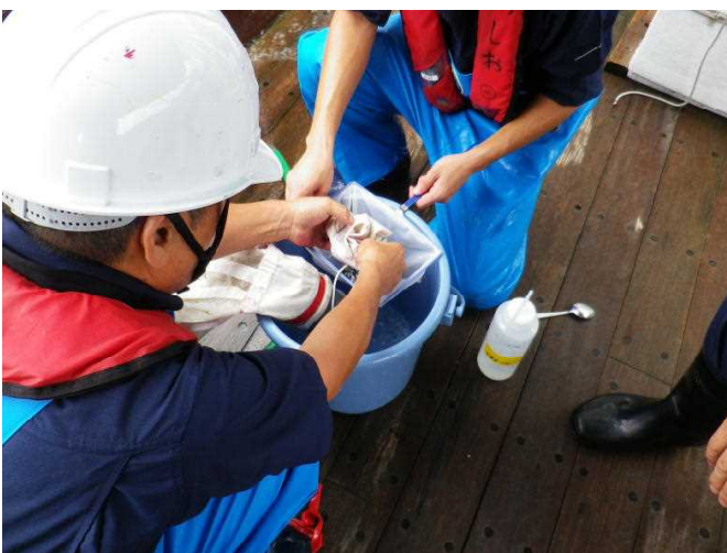
サンプルの回収作業