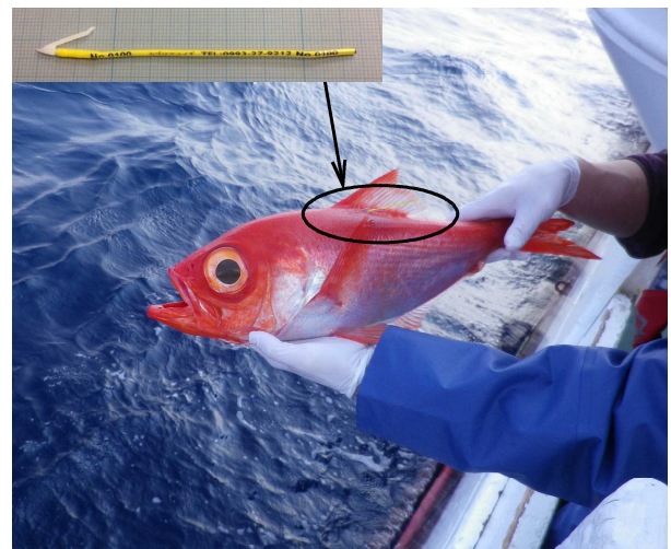
ダートタグを装着した標識魚