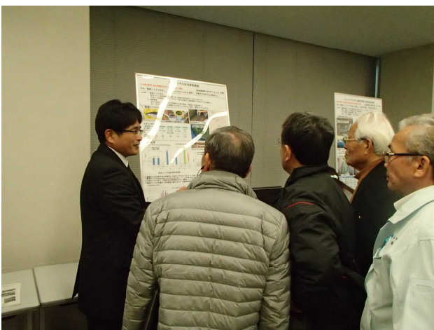
ポ ス タ ー 発 表