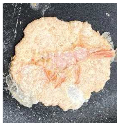
タカエビせんべい