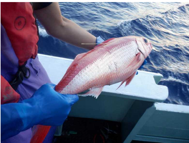
標識を装着したハマダイ