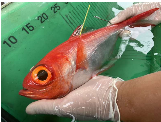
タグ付けされたキンメダイ

標識の付いたキンメダイを漁獲・発見された際は、当センターまでご連絡をお願いいたします。