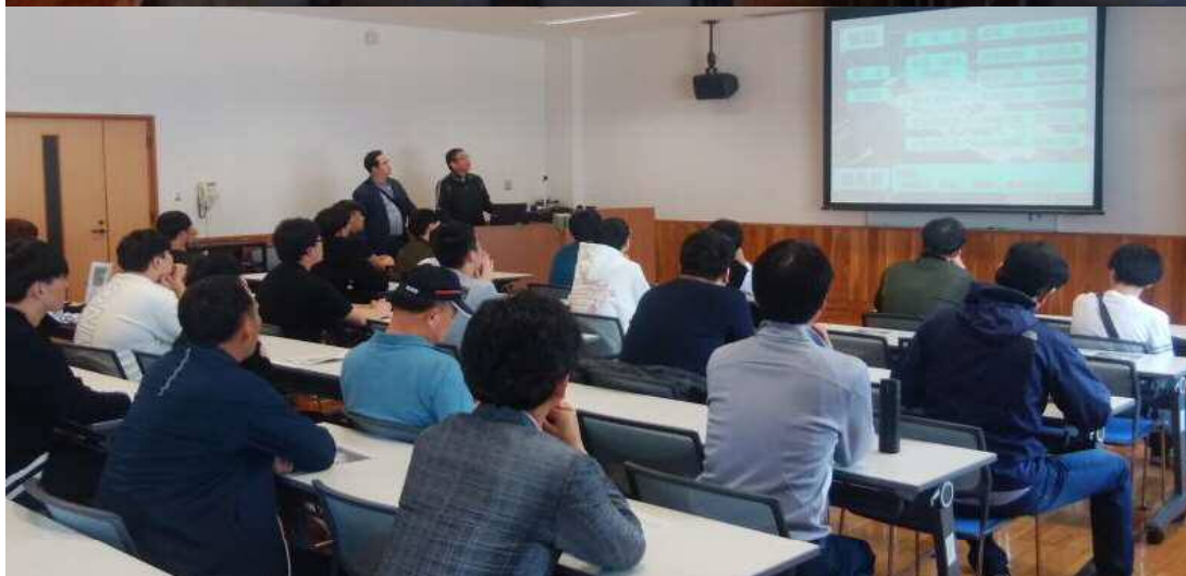
熱心に受講する韓国の水産高校生